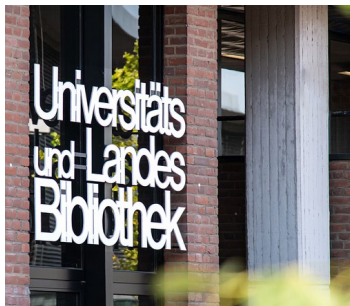
Universitäts- und Landesbibliothek (ULB) 2,5 Mio Bücher